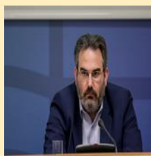
Γενικός Γραμματέας Χωρικού Σχεδιασμού και Αστικού Περιβάλλοντος ΥΠΕΝ κος Ευθ. Μπακογιάννης